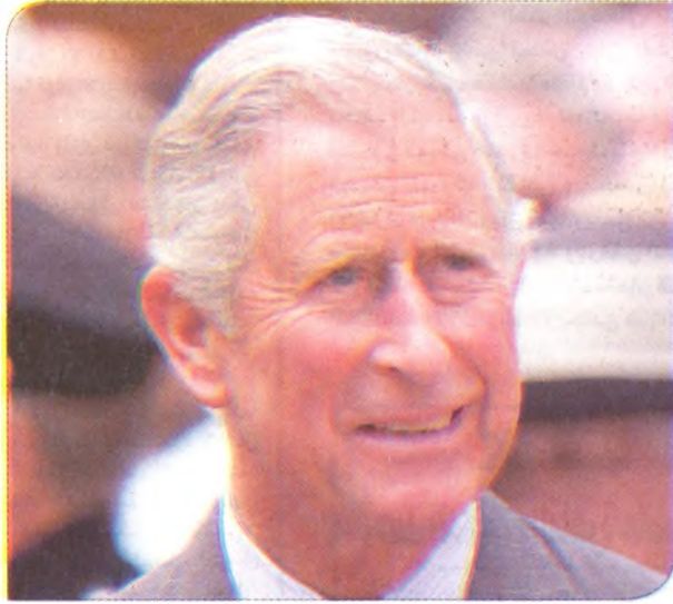
◀ ولي العهد البريطاني الدوق كورنوال الأمير تشارلز